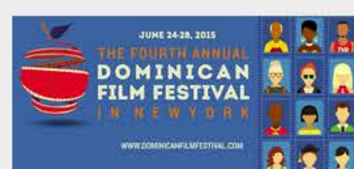
Festival de Cine Dominicano en NY del 24 al 28 de junio