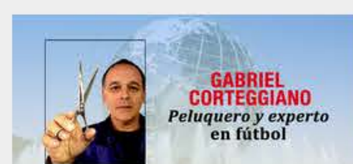
Copa América: Brasil no convence y Colombia avanza de milagro