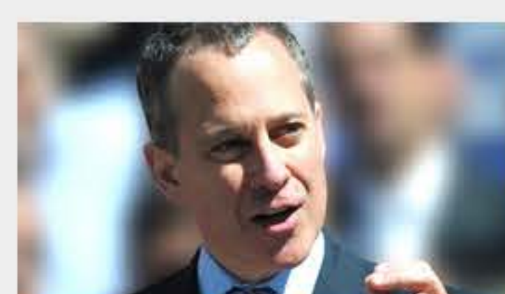
Fiscal Schneiderman anuncia campaña para evitar el fraude de rescate hipotecario