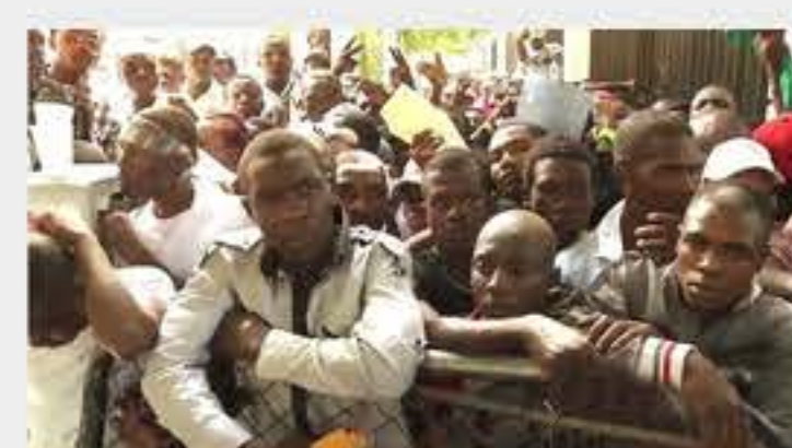
Alcalde de NY Bill de Blasio: 'Deportación de haitianos de Dominicana es inmoral y racista'