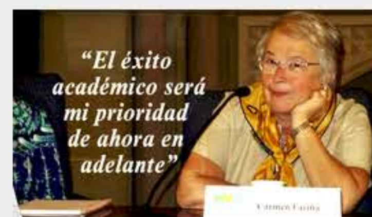
Canciller de Educación de NY le apuesta al futuro