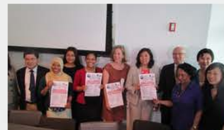
Feria para inmigrantes en la Biblioteca de Flushing el Día de Padre