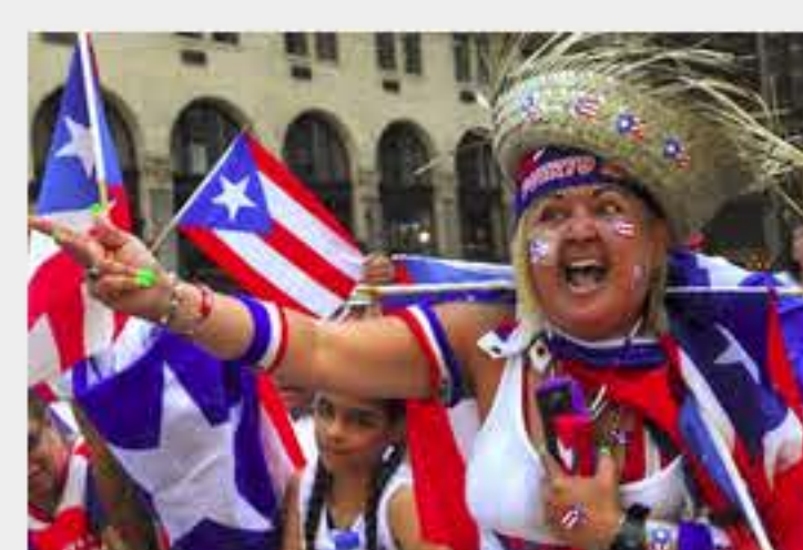
Desfile Puertorriqueño de NY despide al Daily News