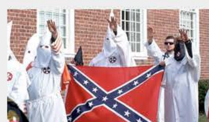
Origen racista de Bandera Confederada sale de las grandes tiendas