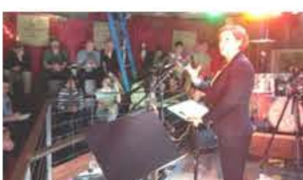
Candidata Christine Quinn visita la Roosevelt y Terraza 7

Hemos heredado un modelo de ciudad cuyo presupuesto depende en gran medida de las impagables multas que nuestros negocios padecen. Exigimos a nuestros pequeños negociantes que empuen su vida y la de sus familias para saldar sanciones que resultan de políticas arbitrarias. Políticas que desangran a los negocios locales y exigen cada vez menos responsabilidades de bilionarios que esquivan aportar a la economía nacional los impuestos que les corresponde de acuerdo con el aumento de sus ganancias.