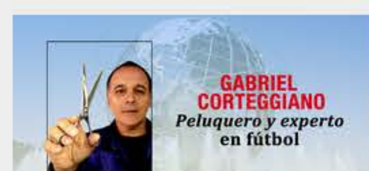
Chile vs. Uruguay este miércoles de Copa América 2015