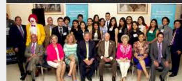
McDonald entrega $30,000 en becas a estudiantes latinos