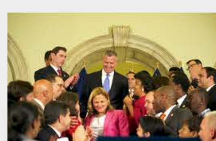
NYC Budget of $79 Billion: 1,279 New Cops, Libraries will Open 6 Days and More Services for Immigrants