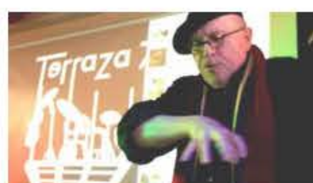
RACA crece y el BID de la Roosevelt se achica