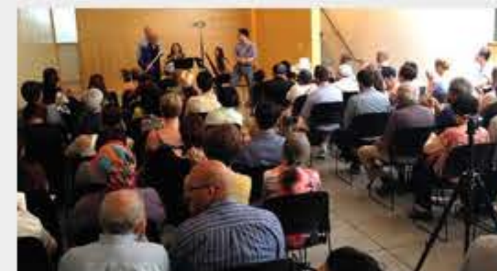
Festival Cultural del Inmigrante el domingo 28 de junio en Paraíso Tropical